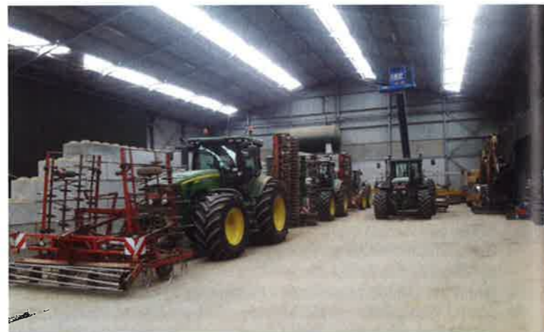
Klein deel van machinepark bij familie van Puymbrouck.