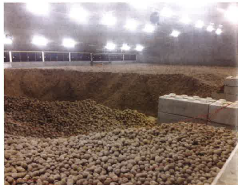
5000 ton aardappelen ras Markies voor levering juli.